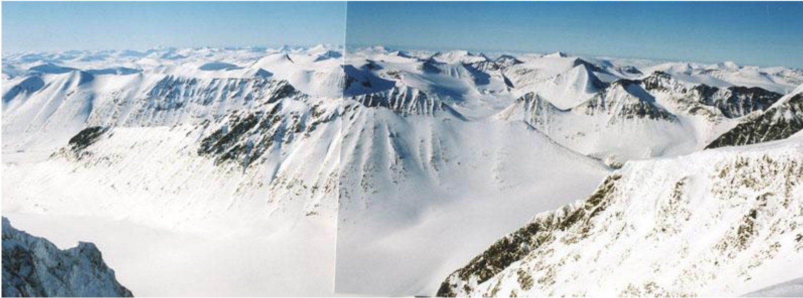
Rabots glaciär framför Drakryggen och alla toppar norrut