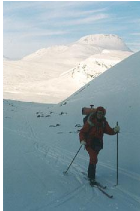
Följer ravinen in i Singivagge, Rusjka i bakgrunden