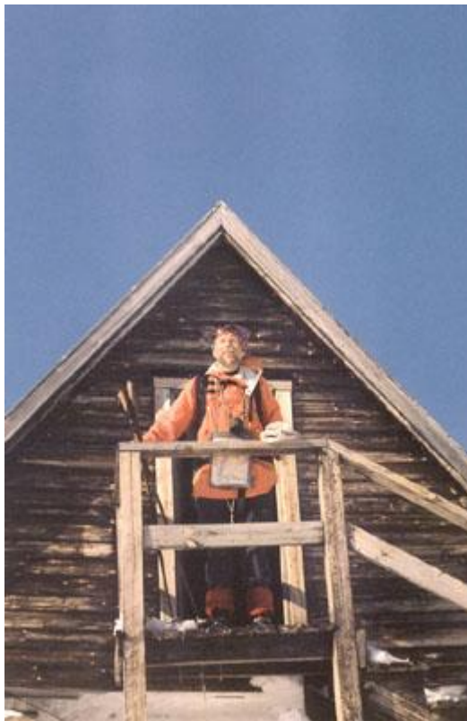
Gamla toppstugan ej igensnöad