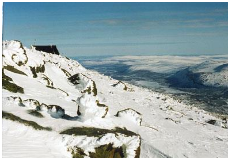
Utsikt mot gamla toppstugan och mot Ladtjovagge österut