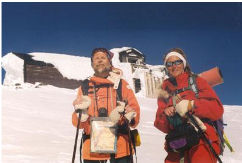
Framför nya toppstugan, igensnöad

Vi går bort till den gamla toppstugan, som inte var några problem att komma in i och vi tar en kopp kaffe där. Fantastisk utsikt runt om, dock har vi ännu inte sett toppen.