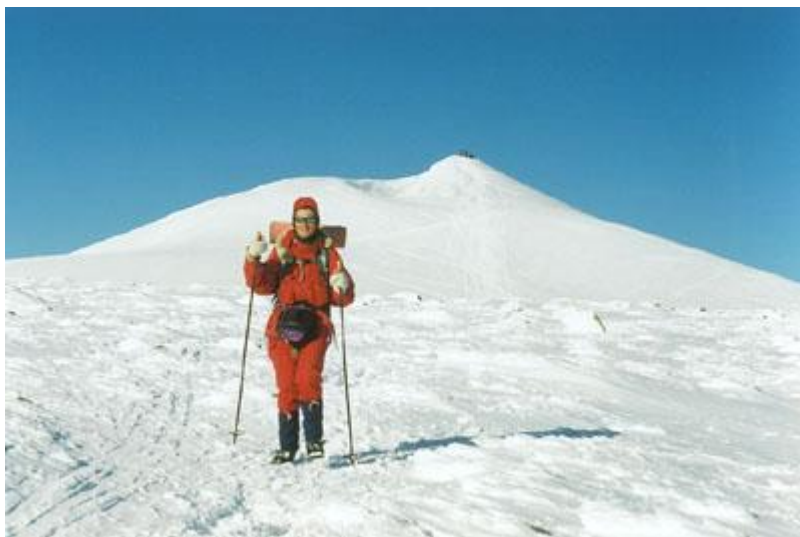
Nerfarten börjar. Dagens andra gång på toppen

Klockan sju är vi tillbaka i Singi, där vår grupp har fått byta stuga och flyttat till stugvärdsstugan. Får mat och hämtar sedan vatten, åter till vardagssysslorna efter en fantastisk dag.