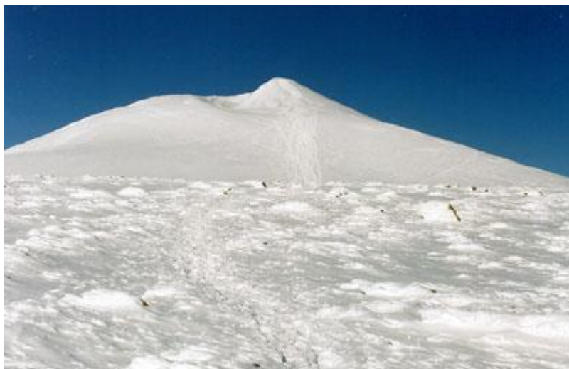
Först sista 500 meterna ser man toppen, brant uppstickande

Vi står där en en halvtimme och njuter och fotograferar. "Det bubblar i magen av lycka" säger Ann-Marie och jag kan hålla med.