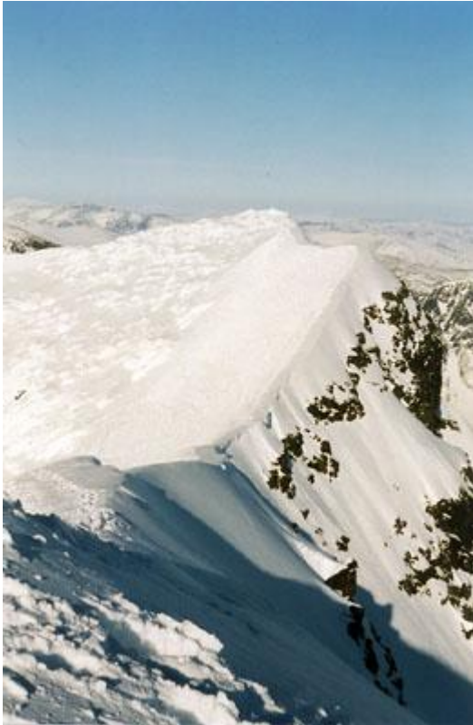
Utsikt mot Nordtoppen