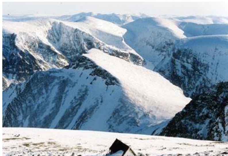
Gamla toppstugan och Tuolpagorni uppifrån