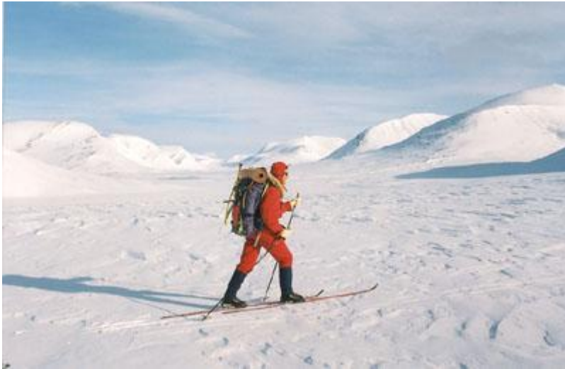
Tvärs över Tjäktjavagge efter renstängslet