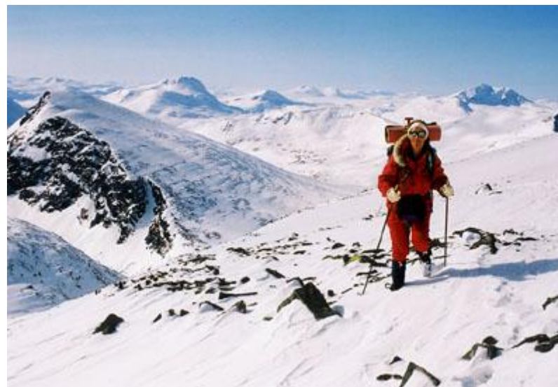
Branten upp från Kaffedalen, dalen där vi kom ifrån i bakgrunden. Rusjka och Sälka längst bort

Efter att ha fått det lite bekvämare så är vi plötsligt strax under den nya toppstugan. Den är till stora delar igensnöad, och det går inte att komma in genom dörren. Två personer till från Singistugorna dyker upp, de har lämnat en tredje i Kaffedalen som hade problem med ett knä, och de tänker nu återvända till honom och Singistugorna. Vi skickar med bud till de övriga i vår grupp att vi nog blir sena (jag skulle även stå för maten i kväll), och att vi tänker gå en bit till mot toppen. Känns skönt att få fram det budskapet.