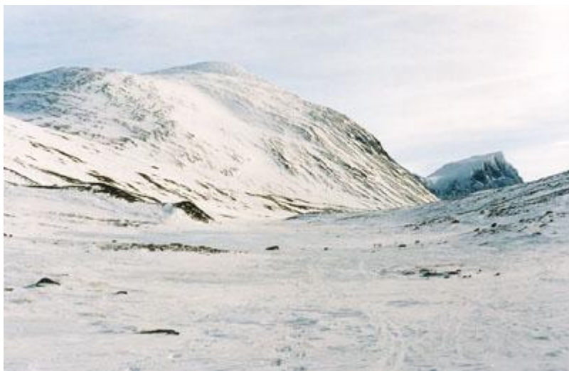
Singivagge med Tuolpagornis baksida i fjärran