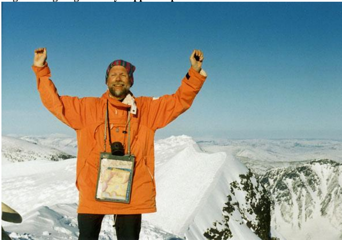
Mats på toppen