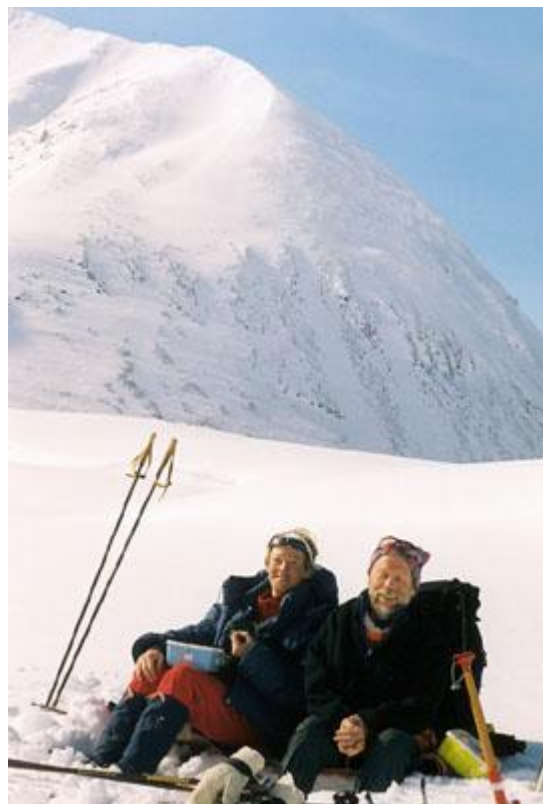
Kafferast med Singitjåkka i bakgrunden

I sakta mak och jämn lunk följer vi jåkken upp till branten innan Kaffedalen. Fina branter runt om oss. Vi trampar uppför sluttningen, i ett smalt stråk norr om jåkken upp mot Kaffedalen och en bit in i dalen tar vi lunch. Hittills har allt gått väldigt bra. Vi är nu på 1530 meters höjd, och har Vierramvare på ena sidan (1700 meter) och branten mot toppen på andra sidan. Österut öppnar sig landskapet ner mot Nikkaluokta.