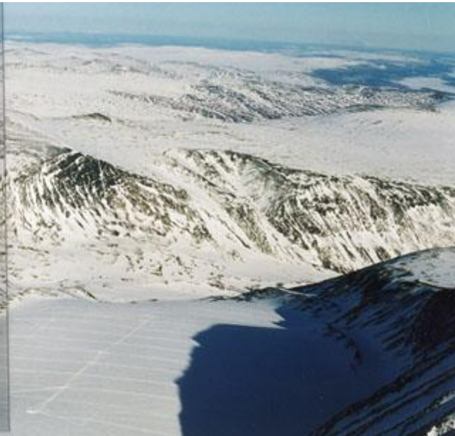
Storglaciären (med märkliga spår)