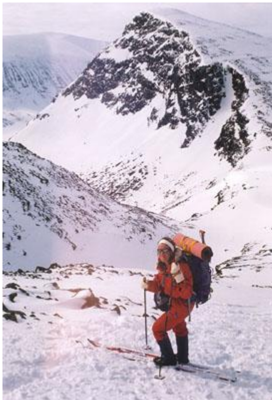
Branten upp mot Kaffedalen

känns det som att det nog vore dags att vända. Efter ett tag till är vi dock i jämnhöjd med dess topp på 1700 meter, och då har vi avverkat 200 meters höjd från dalen. 400 meter till känns jobbigt, även om lutningen nu minskar lite. Men nog måste vi se toppstugorna i alla fall, så vi fortsätter. Vi får även mer och mer utsikt söderut.