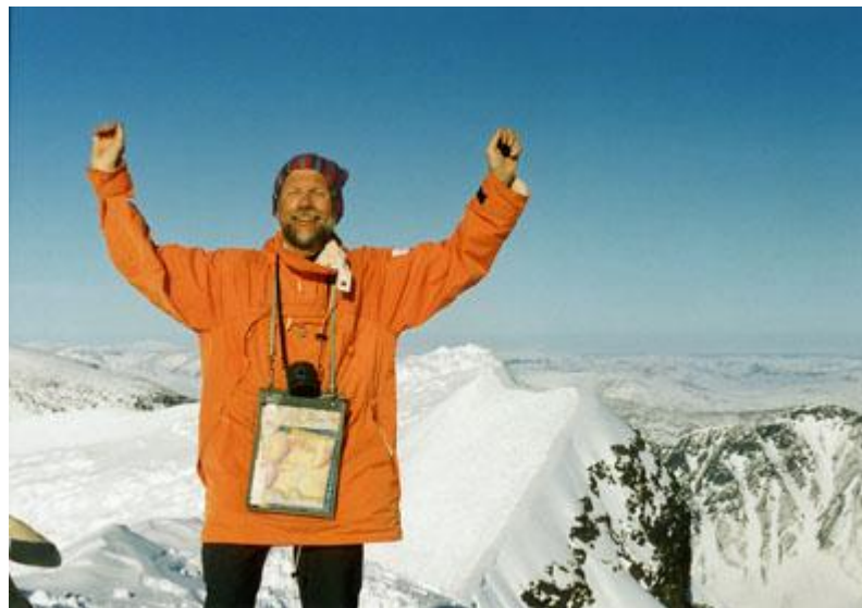
Så här roligt är det att vara på toppen.