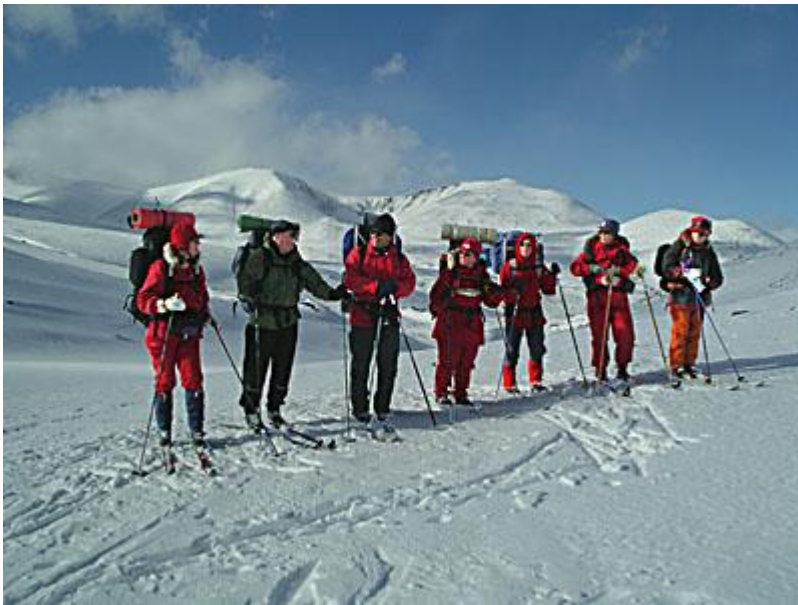
Gruppen med Rondanes fjäll i bakgrunden.