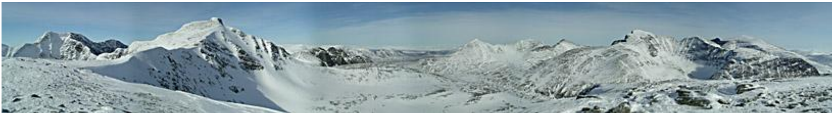
Utsikt från höjden innan Veslesmeden (3/4 varv)