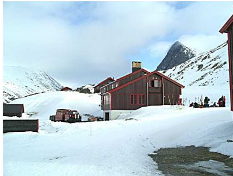
Rondvassbu, den största hyttan.