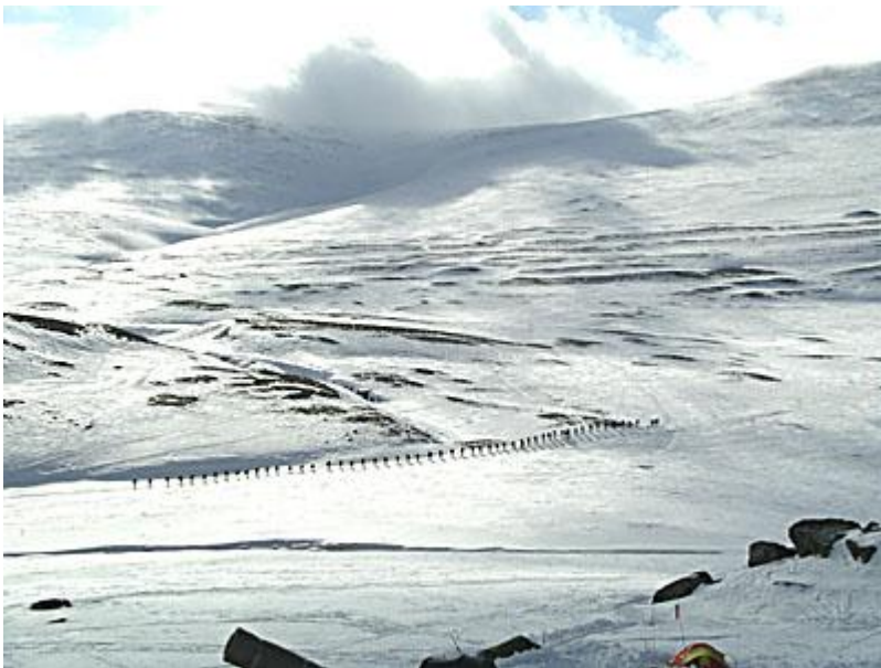
2 norska idrottsklasser på väg i god disciplin.