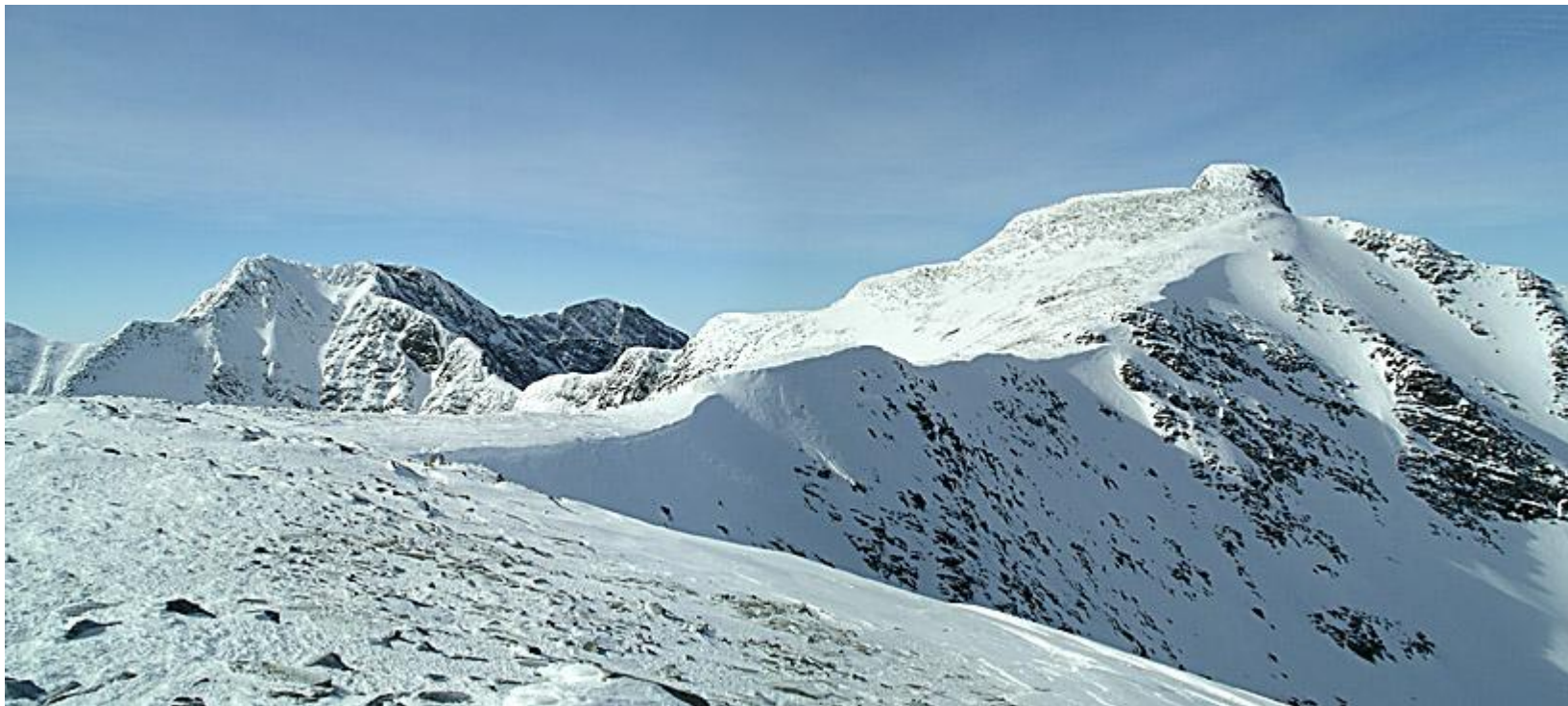
Storsmeden (2016 m)