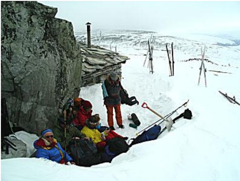
Rast vid gammal, privat, skifferhytta, Ljosåbui på väg mot Peer Gynthytta, som vi inte åkte fram till, och Mysusaeter.