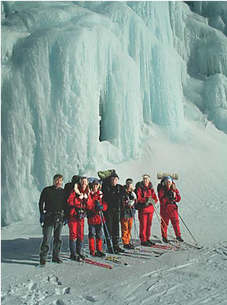
Gruppen vid isfallet strax innan Rondvassbu.