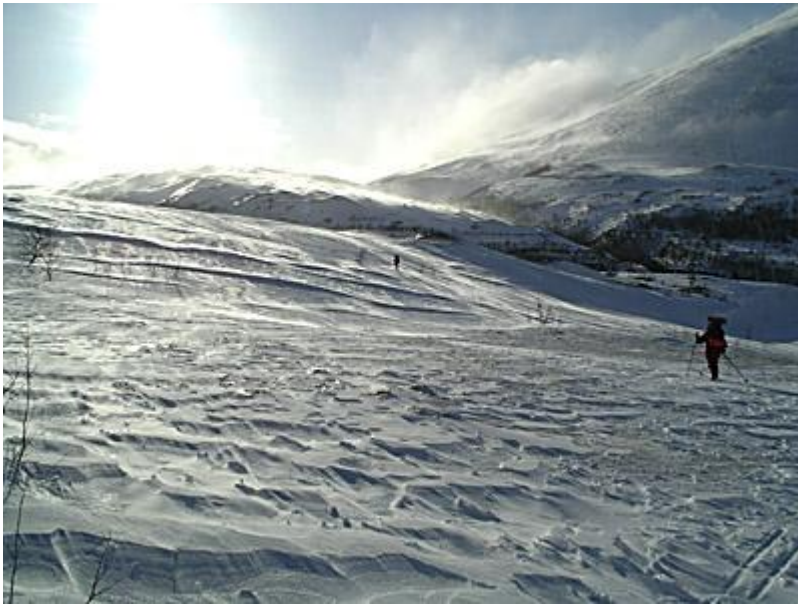
Den fina nysnön blåser bort och ersätts av hårda skavler, svåråkt. Björnhollia, den finaste hyttan.