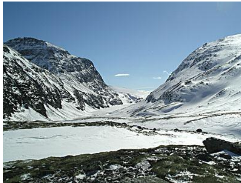
Ner mot Rondvattnet.