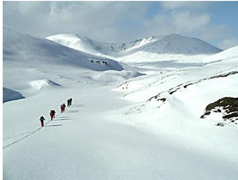
Genom Steindalen mot Rondanes höga fjäll, dit vi når den andra dagen.