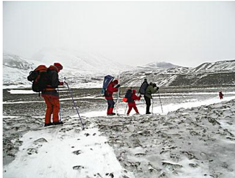
Mycket snö bortblåst när vi närmar oss dödisgroparna och det mystiska istidslandskapet vid Dörålseter.