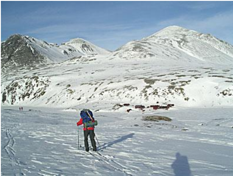
Strax nere, Rondvassbu i mitten på bilden, Storronden ovanför.