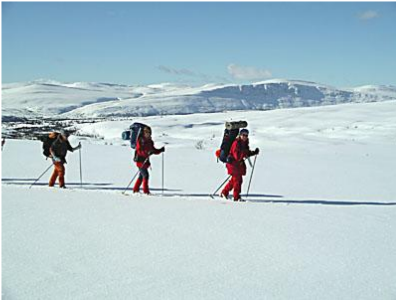
Härlig nysnö de första dagarna. Här går vi orösat (ej kvistet) mot Björnhollia.