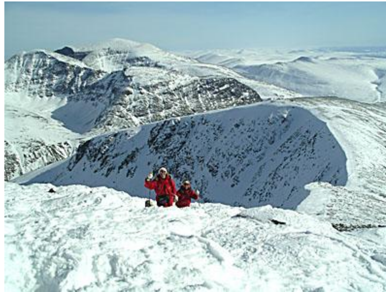
På väg upp till Veslesmeden till fots, skidorna på höjden till höger.