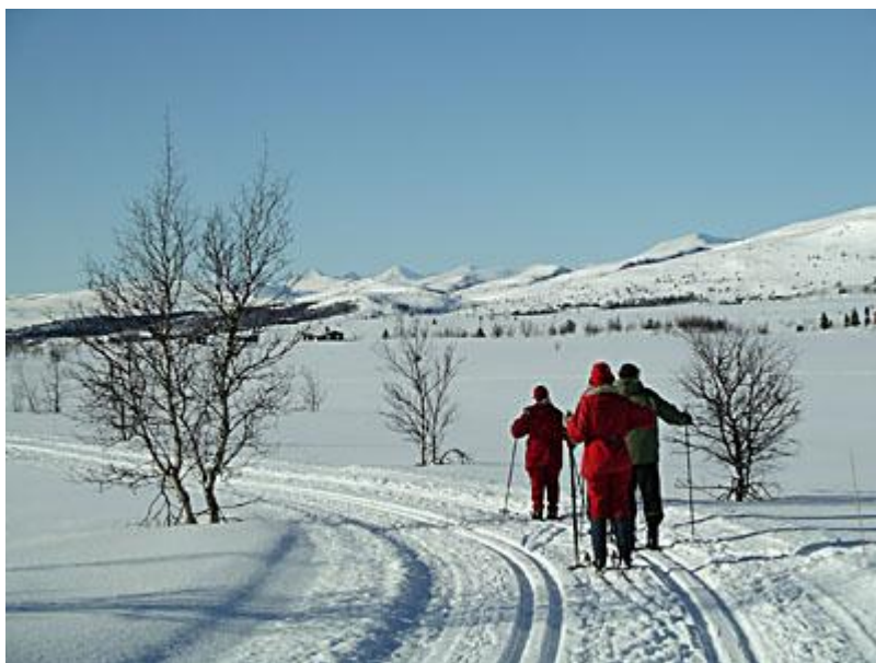
Venabu erbjuder mängder med fina, preparerade spår. Vi provar dessa samma dag vi kom fram, innan den goda kvällsmaten..