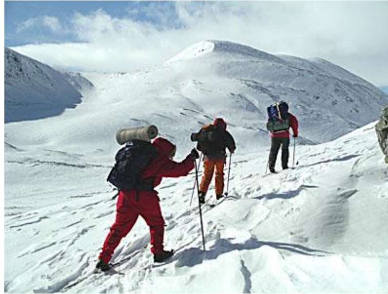
Dagstur på tisdag in i Illmandalen, öster om Rondvassbu.