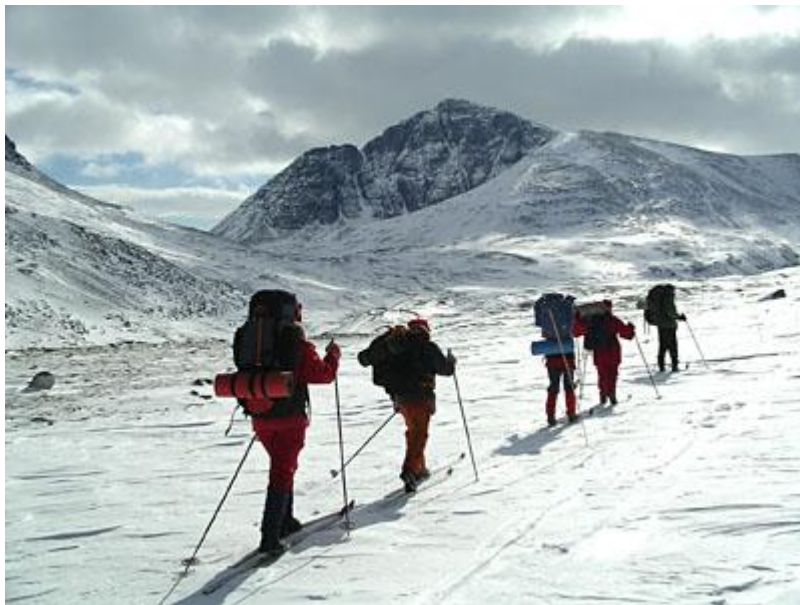
Rondslottets baksida passeras, på väg mot Rondvassbu.