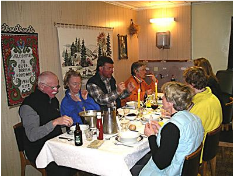
Som vanligt 3-rättersmiddag i trevlig hytta, denna gång Dörålseter. Hyttan öppnade samma dag vi kom fram (skulle egentligen vara obemannat), så de lagade middag åt oss, som vi åt vid niotiden.