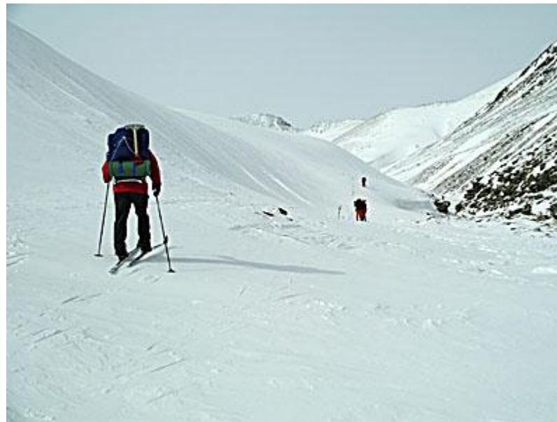
Ett evigt gående på skrå på stenhård snö, frestar på högerbenet.