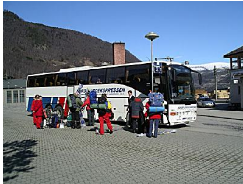
Nordfjordexpressen på fredagen från Otta till Gardermoen. Även själva minibussturen från Mysusaeter, med Rondanes fjäll i bakgrunden, var en upplevelse. Likaså bussresan till/från Oslo genom den vackra Gudbrandsdalen..