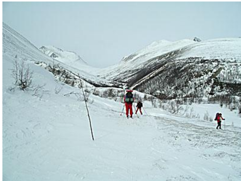
Genom Langglupdalen. Dåligt med snö, dessutom hårdpackad. Först 100 meter upp, sedan 100 meter ned och sedan 500 meter upp till passet i mitten av bilden, 10 km bort, under Rondslottet till vänster.