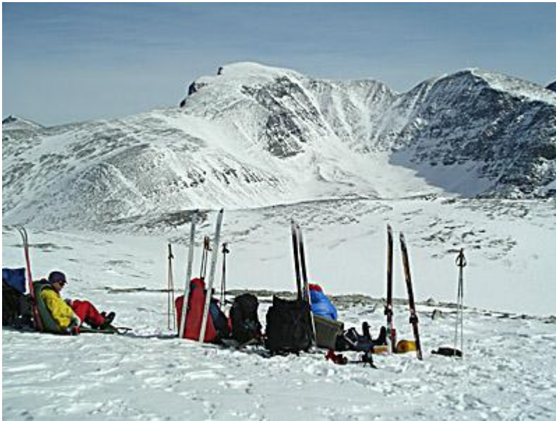
Rast med Rondslottet i bakgrunden på onsdagen. På väg mot Veslesmeden.