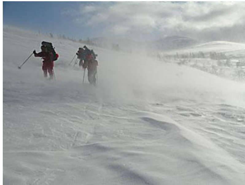
Kulingvindar vid nerfarten mot Björnhollia, snön rör på sig.