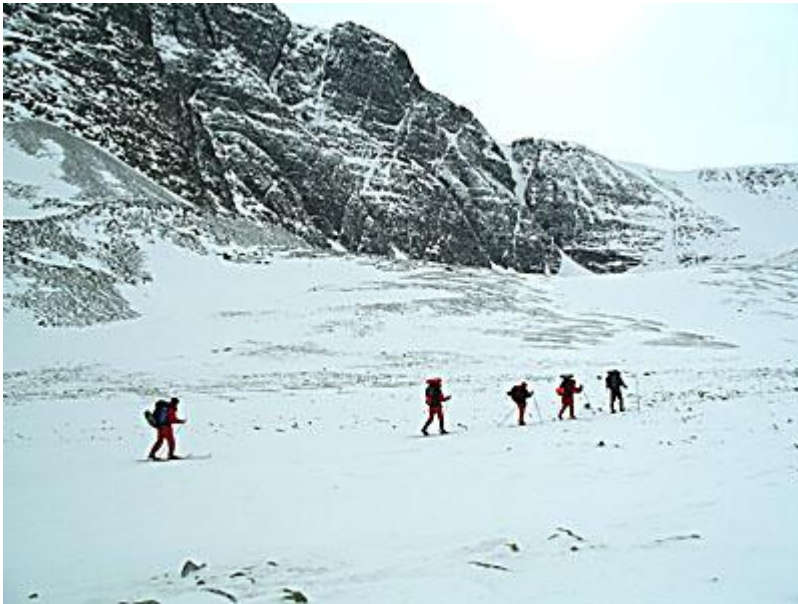
Passet på 1450 meters höjd passeras vid fyratiden, nu "bara" 10 km kvar. Den eventuella kulingen uteblir.