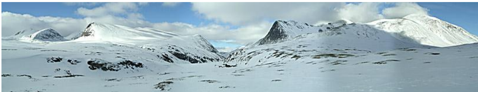
Utsikt från sluttningen upp från Illmandalens sydsida, mot Rondanes fjäll i norr