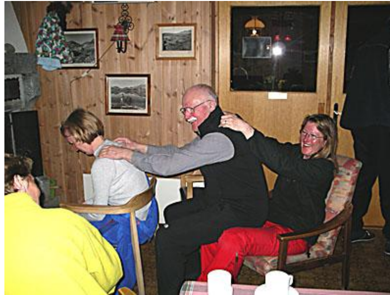
Massage av trötta axlar.