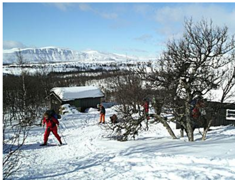
Vi lämnar Eldåbu på lördag morgon, obemannad stuga 17 km från Venabu.