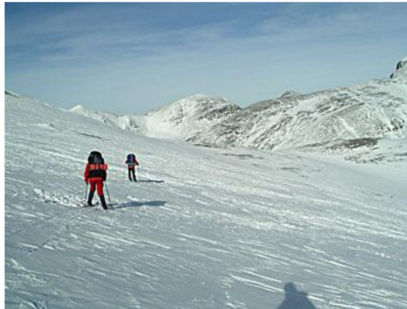
Hyfsad utförsåkning på omväxlande underlag, skare, lössnö och drivor som förorsakade en del fall..