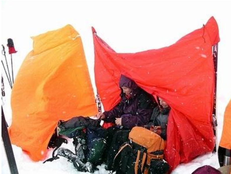
Rast i/utanför vindsäckar