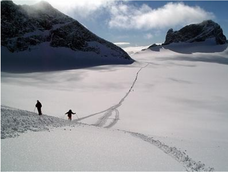
Skidåkning utför sista branten ner mot Storjuvbreen