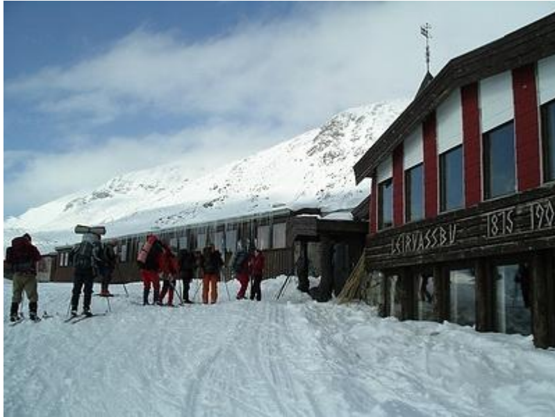
Framme vid Leirvassbu