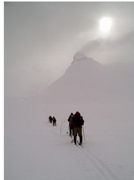
Upp mot Kyrkjäs "pyrande vulkan"