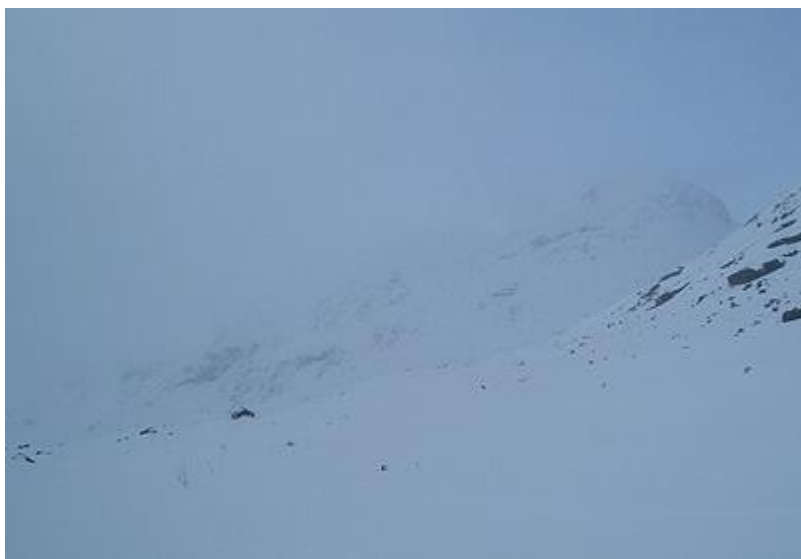
Olavsbu (2 stugor), ödsligt, och troligtvis vackert, beläget