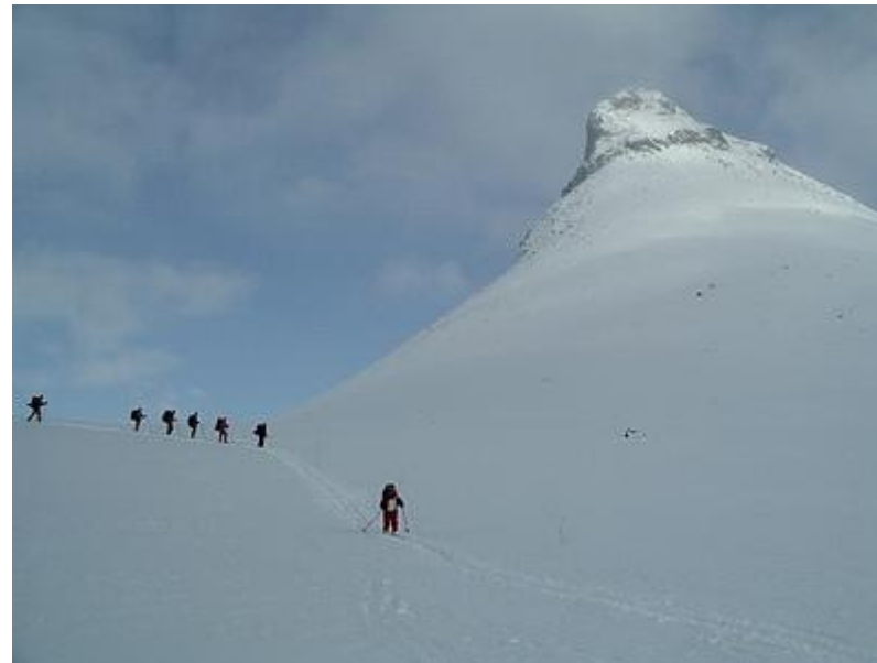
Kyrkja passeras, ner mot Leirvassbu