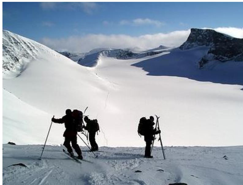
Illåbandet, många tar av sig skidorna i branten ned mot Illåbreen. Tverråbandet syns längst bort.