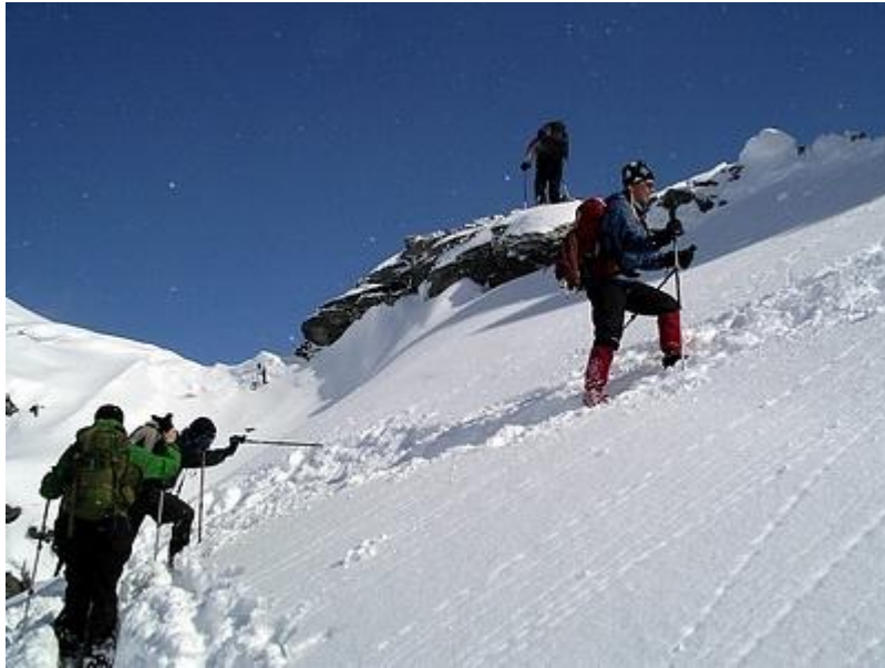
Uppför branten mot toppen