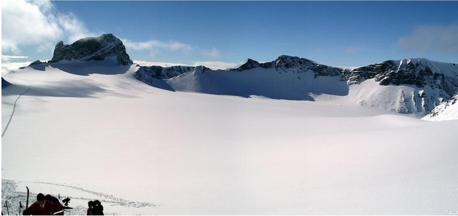
Skarstind och Storjubrean