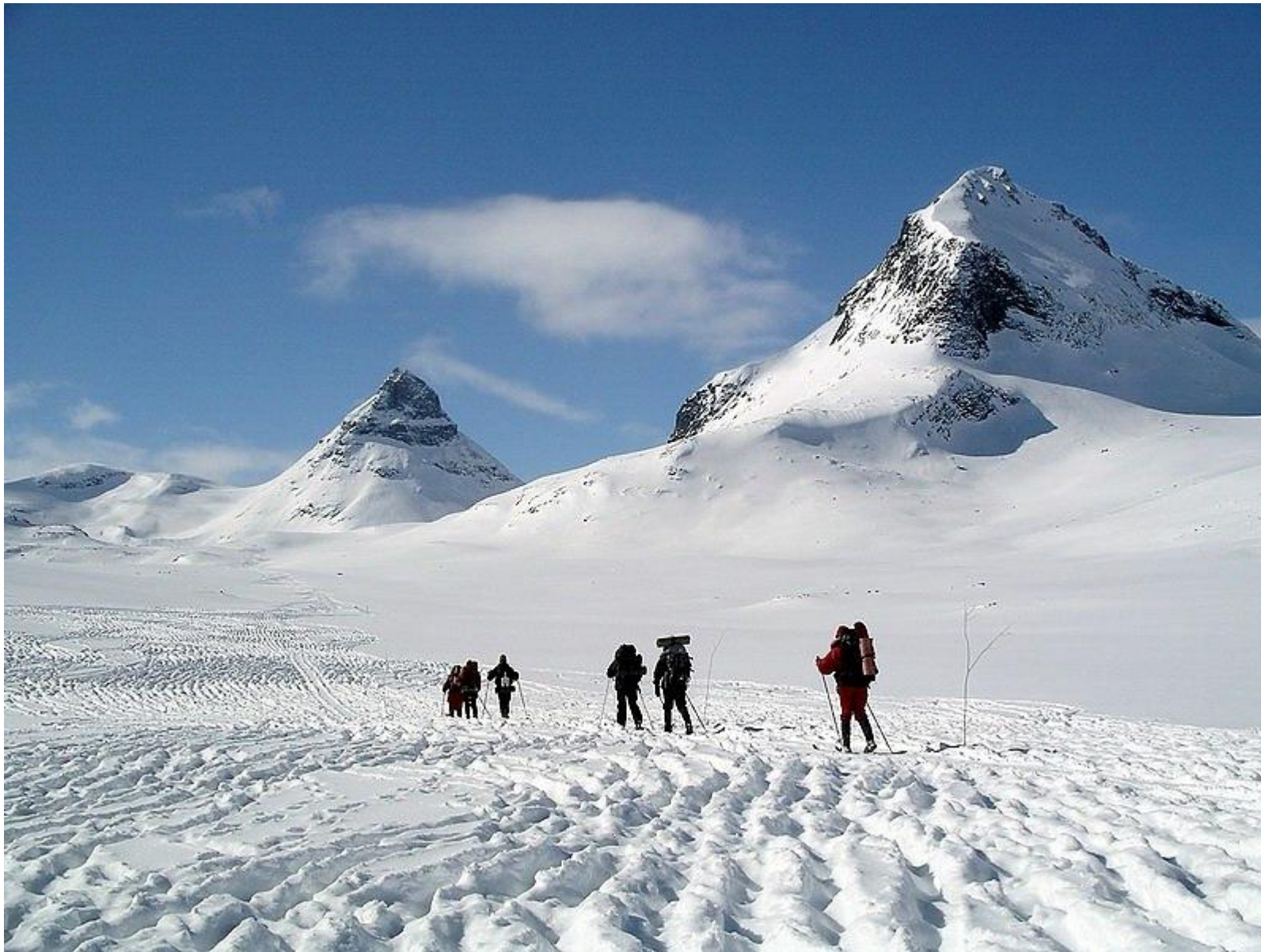
2300 renar har spårat (plogat) åt oss. Kyrkja och Tverrbyttthornet i bakgrunden