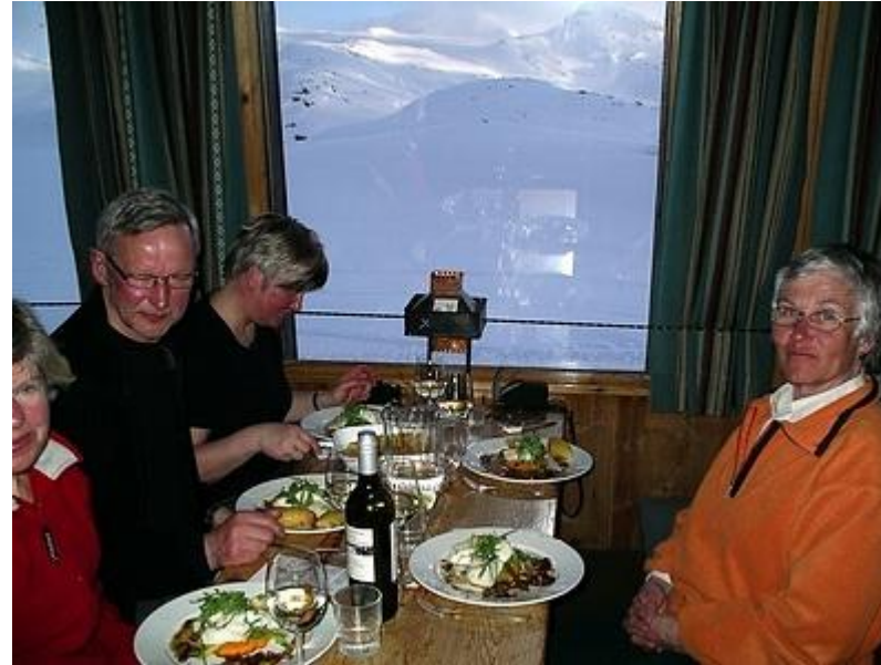
En kulinarisk måltid, på lokala råvaror.

Nästa morgon gav vi oss i kast med den branta backe, som så småningom skulle ta oss mot Gjendebu, som ligger i den västra änden av sjön Gjende. Vi har skaffat oss stighudar inför denna tur, och dom klistras nu på. Det var behändigt att ha stighudar. Man kände sig säker på sin väg uppåt och slapp spänna lårmusklerna för att inte halka bakåt. Lite brantare än vanligt gick vi allt, men det är bedrägligt att tro att man kan gå rakt upp. Man skall ju ändå lyfta både sig själv och en ryggsäck på 12 kilo. I så fall måste nog konditionen och styrkan vara bättre! Denna dag bjöd på skapligt väder, stora höjdskillnader och branta backar, men också på en 6 km lång sjö och en förfärlig nedfart mot Gjende genom björkskogen. Gjendebu är nyrenoverat och ligger lite vid sidan av vintertid. Där fanns bara två gäster förutom vi. Det är lite lågland och ligger "vid vägs ände". (Sommartid åker man båt på Gjende och når då t.ex. Besseggen, en av Norges populäraste vandringsleder.)