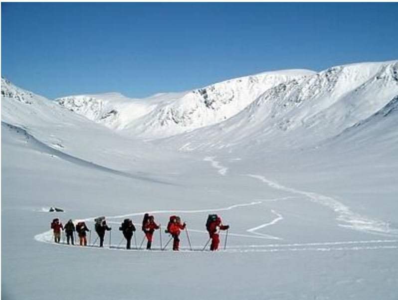
Visdalen bakåt från slutningen upp mot Kyrkja