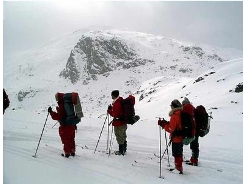
Passerar ovanför Hellerfossen