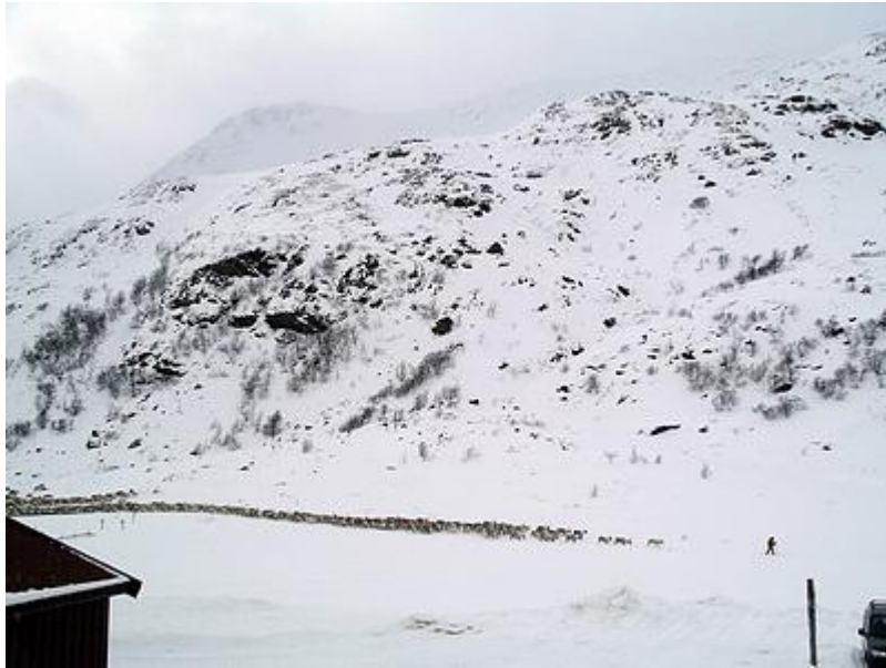
2300 renar passar förbi

det om att 2300 renar var på väg att passera på andra sidan älven. Mycket riktigt, där kom dom anförda av en skidåkande renskötare och en ledarren. Det var som en Skum-tavla när hjorden liksom flöt fram i dalen. Man visste verkligen att man var i fjällen!