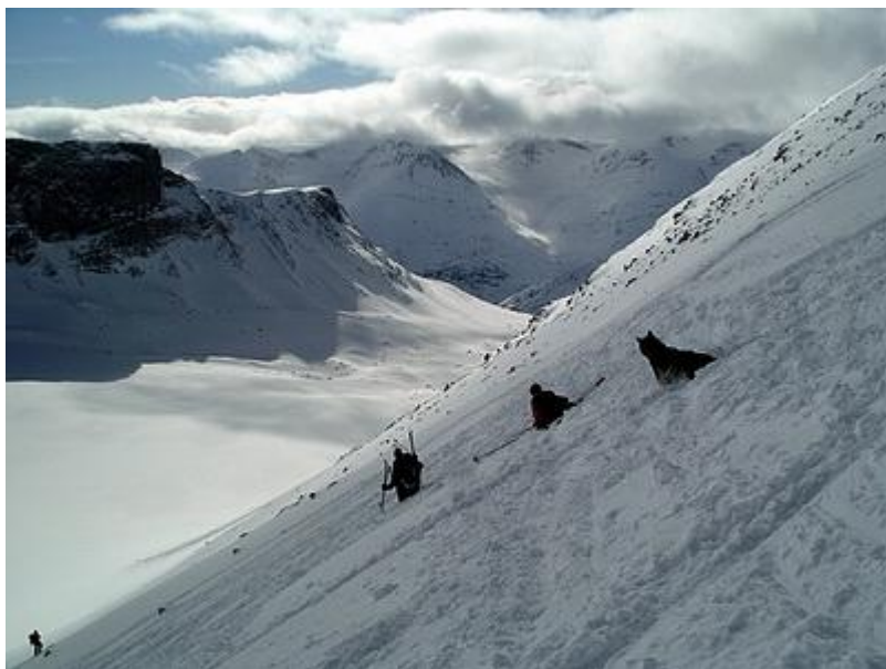
Illåbandets branta nerfart