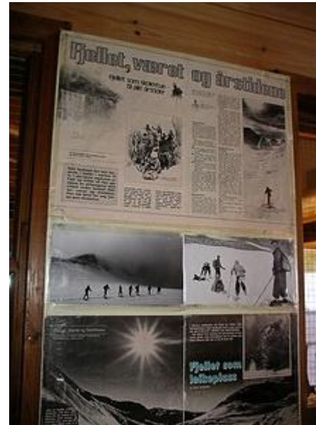
Fjället som lekplats