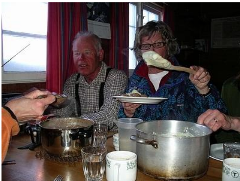
Potatismos och xxxxx