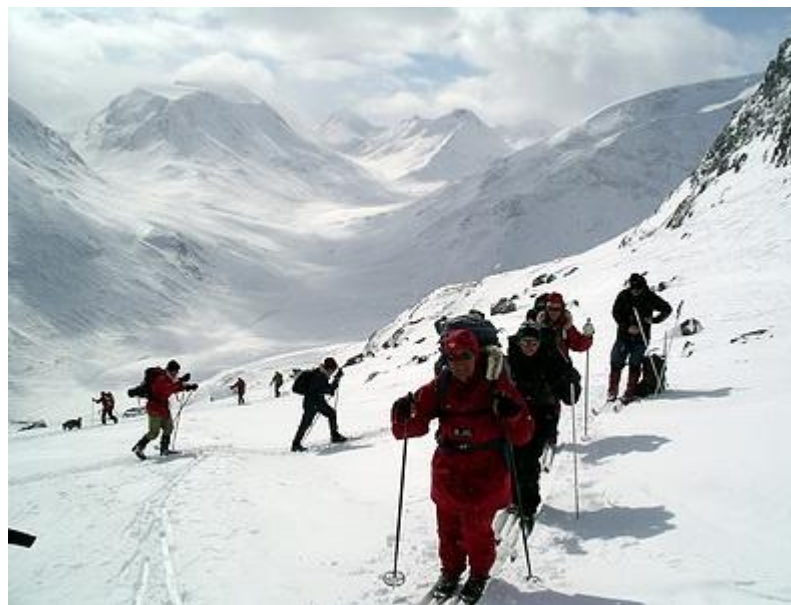
Uppför branten. Visdalen och Hellstuguhöe i bakgrunden.