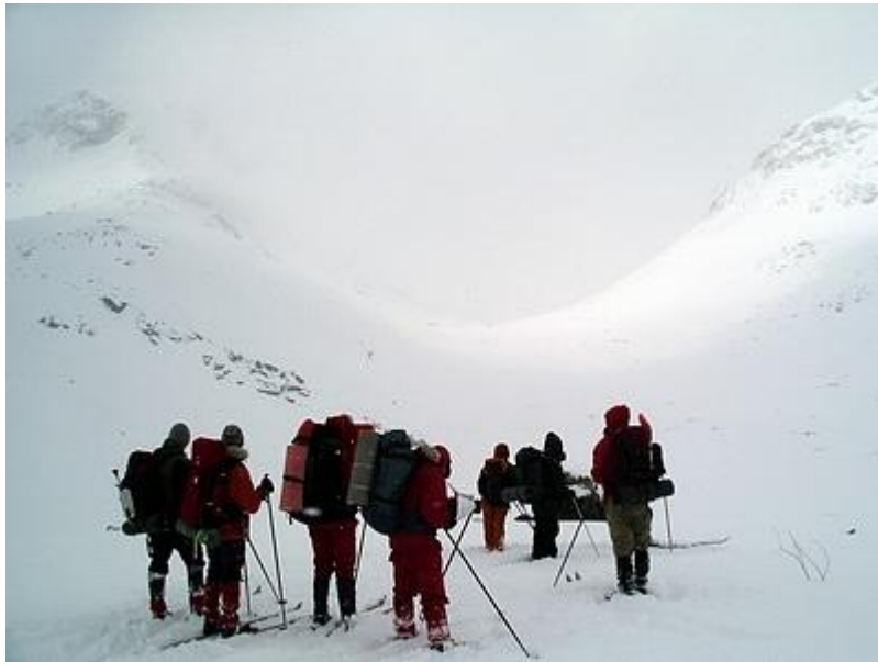
Simledalsbandets U-dal passeras