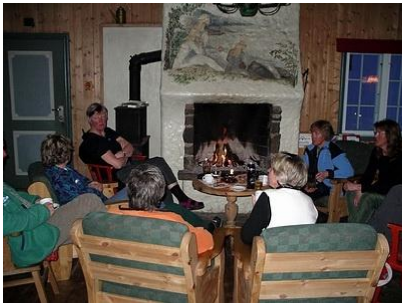
Kaffe vid brasan