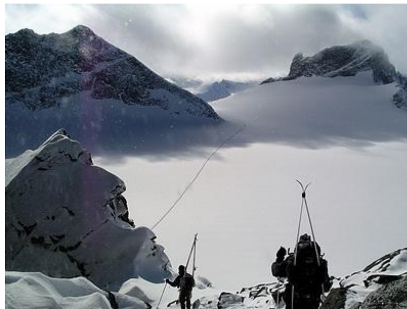
Med skidor på ryggen ner i Porten, Skarstind till höger, Storjuvtinden till vänster