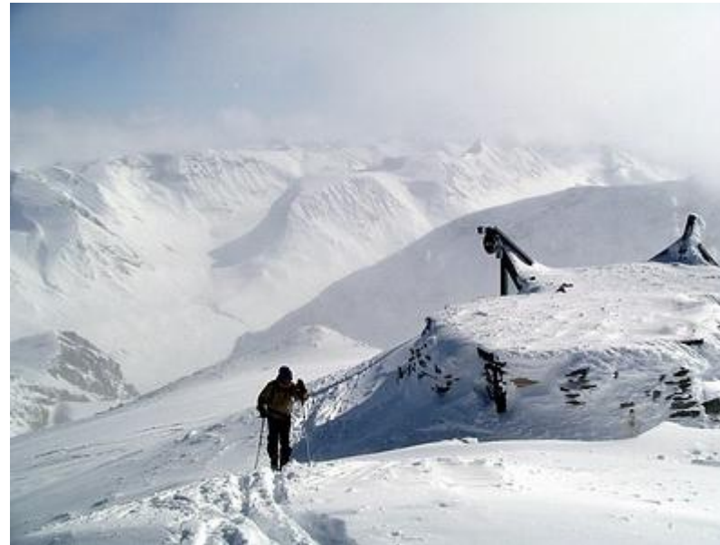
Toppstugan. Hellstugudalen i bakgrunden