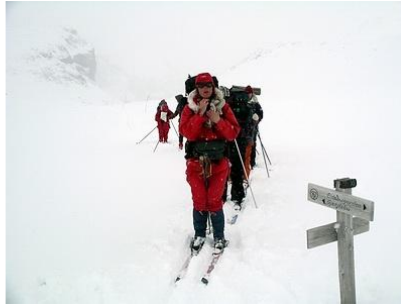
Vägskälet mot Fondsbu resp. Olavsbu, dålig sikt