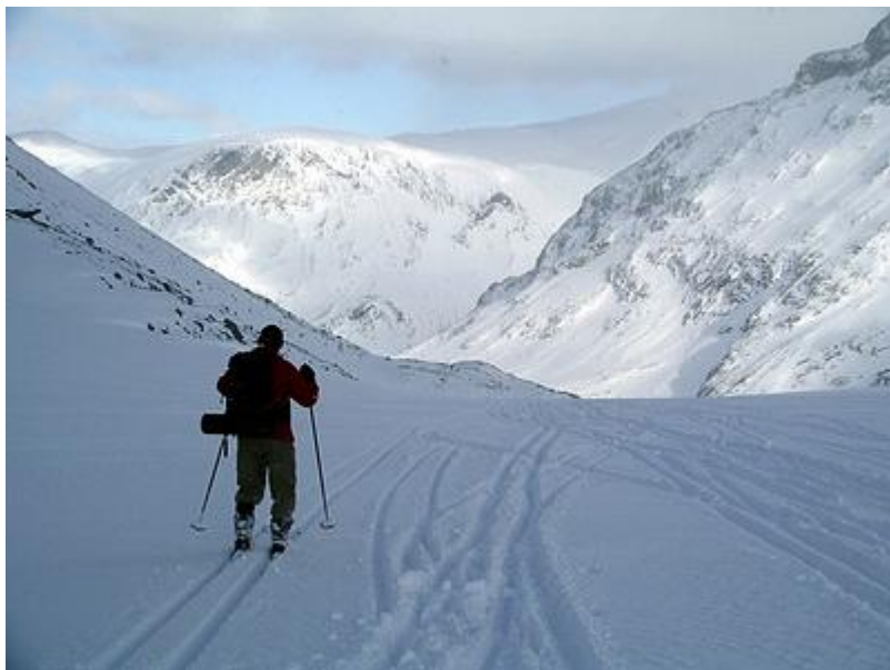
Nerför Tverråbreen i behaglig lutning och lössnö