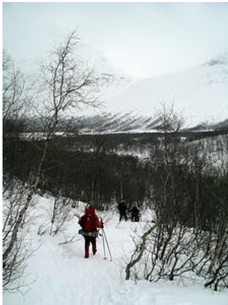
Genom hemsk björkskog på slutet