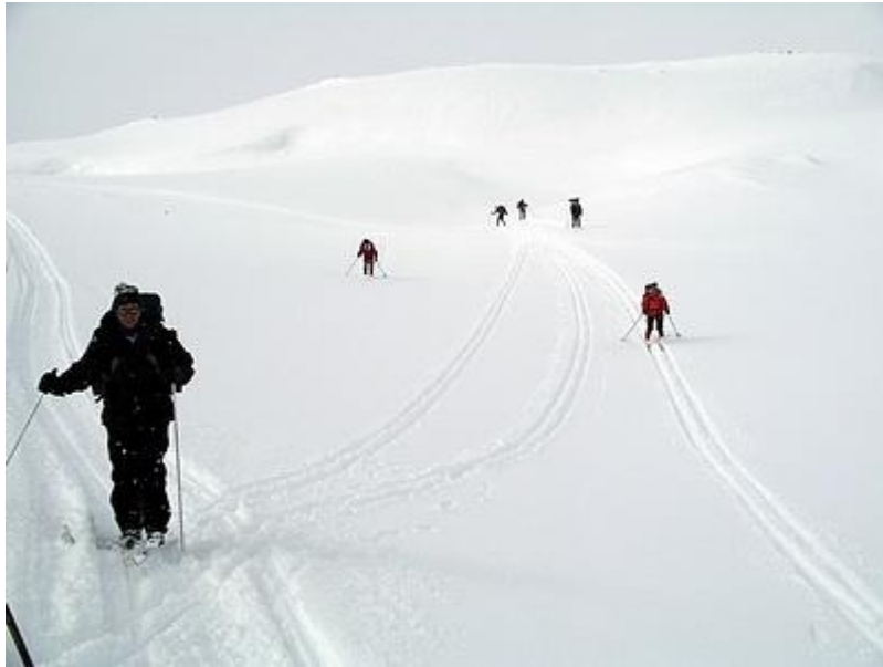
Sluttningarna öster om Langvatnet