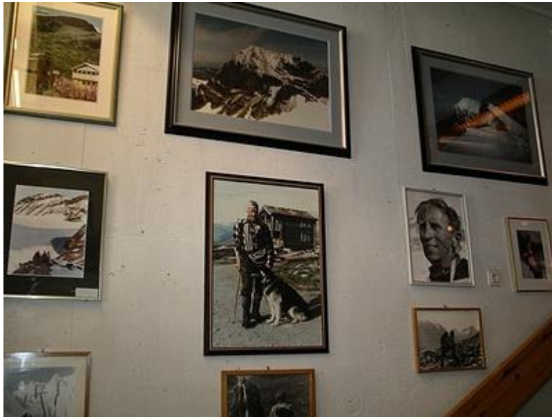
Tavlor i hallen med Spiterstulens långa historia