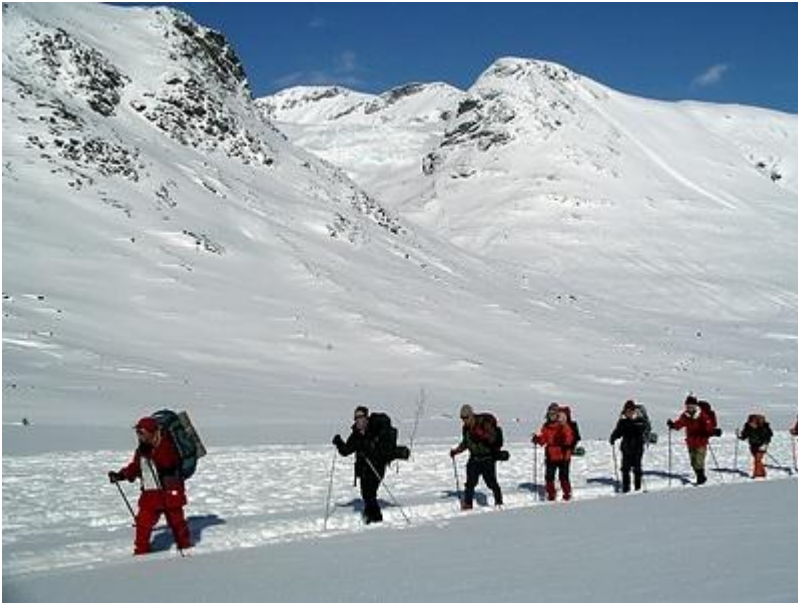
På väg, Svellnosbreen syns längst upp i dalen