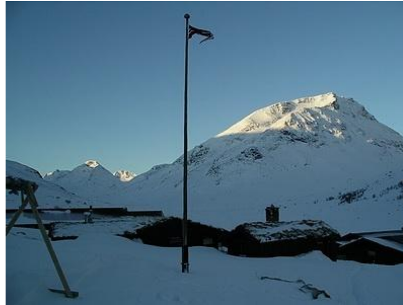
Soluppgång vid Spiterstulen