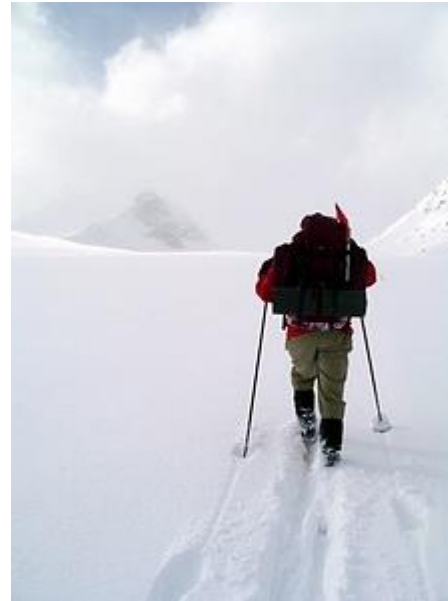
Spårning mot Olavsbu, Mjølkedalstinden skymtar plötsligt