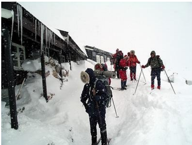
Vi lämnar Olavsbu i snöfall

Vi återvände till Leirvassbu, som nu invaderats av 200 påskfirare. Det är en vanlig utgångspunkt för påskturer. Den här natten fick några av oss sova på golvet, extra madrass i varje rum var nu regel. Efter att ha njutit ännu en fantastisk middag, återvände vi följande dag till Spiterstulen i tidvis fallande snö, de vallningsfria skidornas värsta fiende. Inget hjälpte, det fastnade under. Vi prövade 5 sorters valla och spray, men fick ändå stappla fram i fastnande snö.