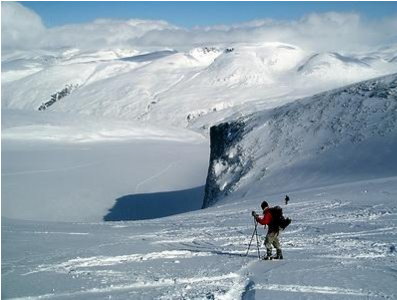
Nerfart i lössnö på Piggbrean,