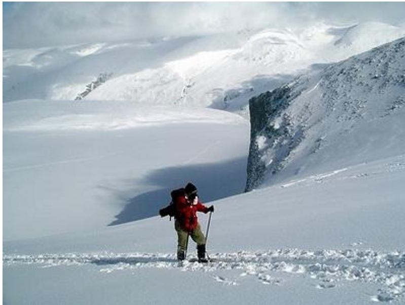
Mot toppen på Piggbrean, Styggebrean i bakgrunden