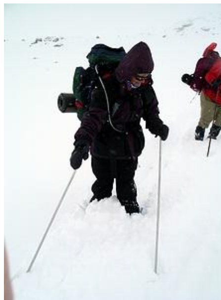
En halvmeter snö bromsar i nerfarten vid Rauddalsbandet