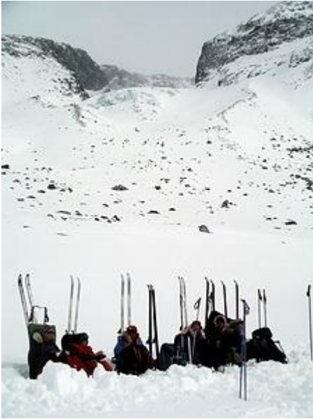
Rast vid Hellstugubrean, nedanför Store Memurutinden