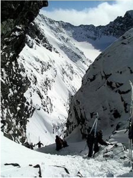
Ner i Porten