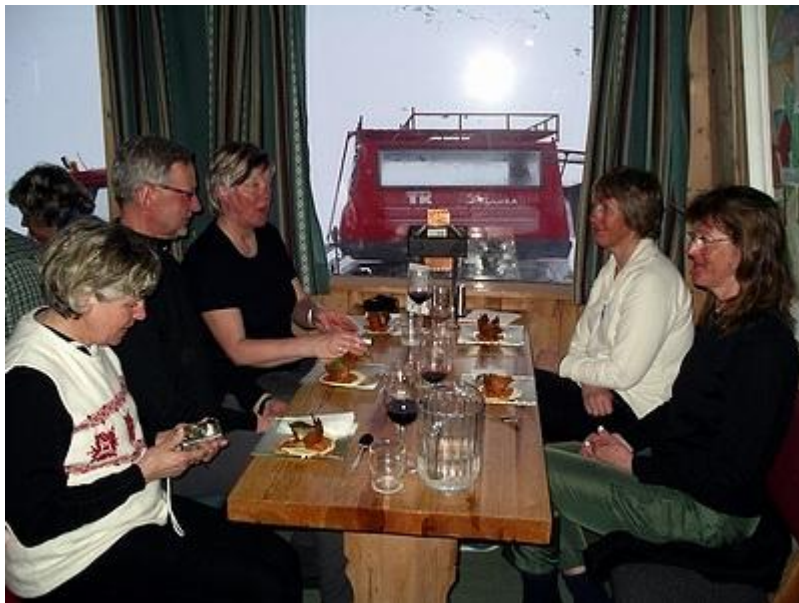
Ännu en kulinarisk måltid i Leirvassbu