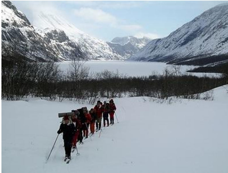
Gjende, med Besseggens kam i mitten längst bak