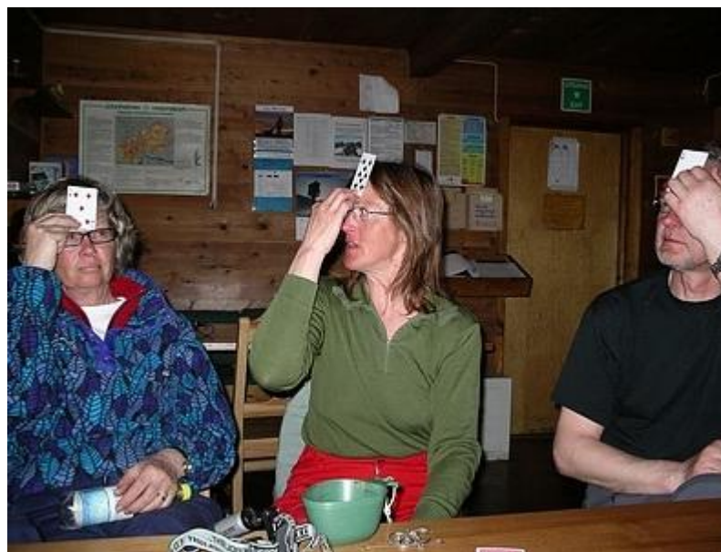
Plump spelas som vanligt på våra turer