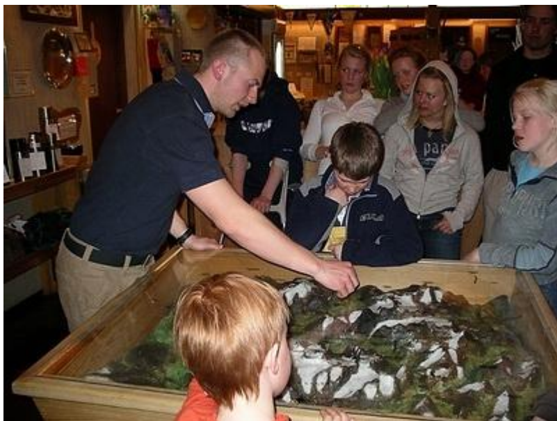
Förertime, morgondagens turer går igenom m.h.a. modellen