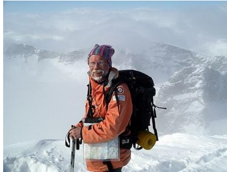
Mats på toppen