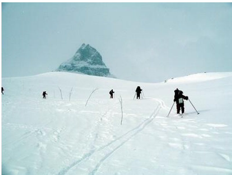
Ner från Kyrkja, mot Spiterstulen i lössnö