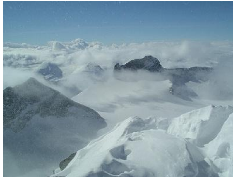
Topparna, bl.a. Skarstind, sticker upp ur molnen