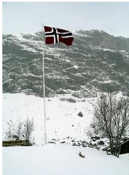
Norska flaggan vajar stolt