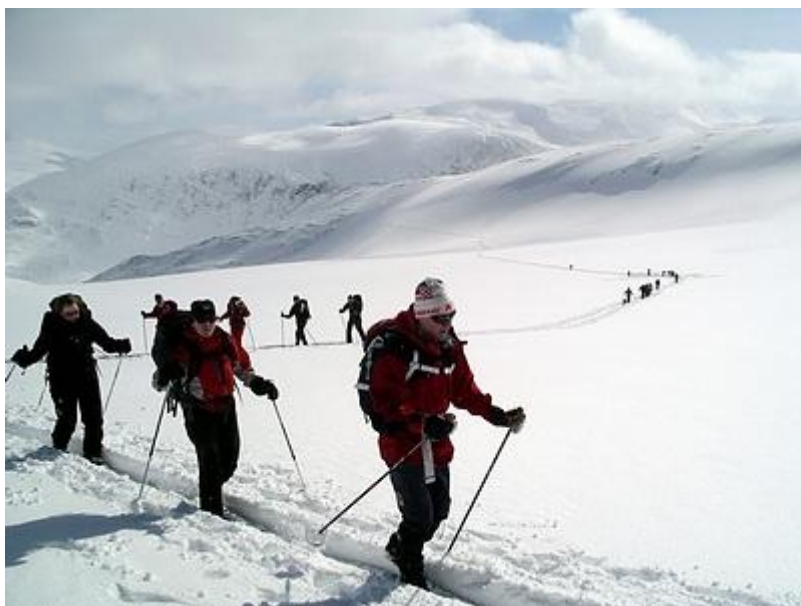
Uppe på Styggebrean