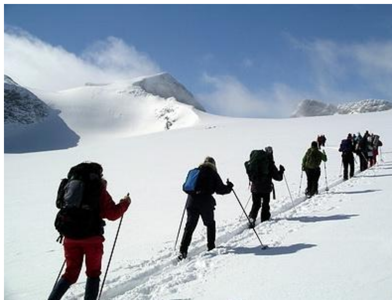
Över Styggebrean, Galdhöpiggens topp syns i mitten