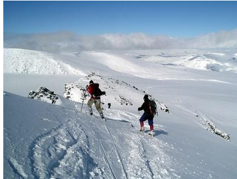
Nerfart i lössnö, dags att bromsa innan kanten