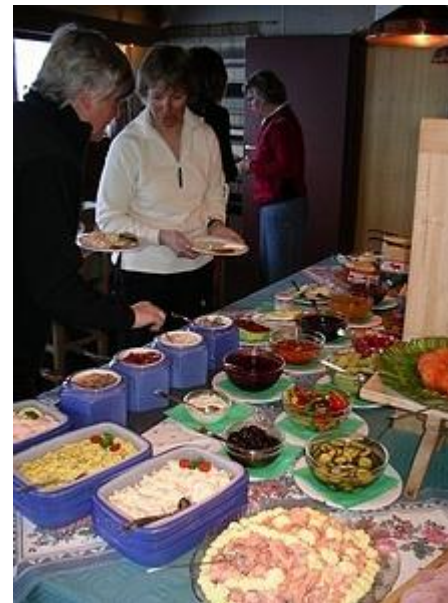
Spiterstulens lyxiga frukost