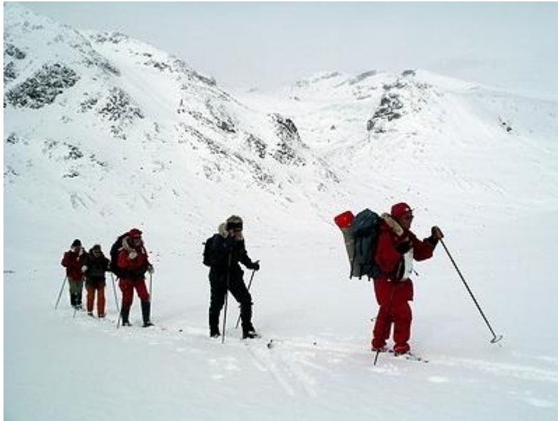
Uppför Hellstugudalen, Eventyrsisen i bakgrunden