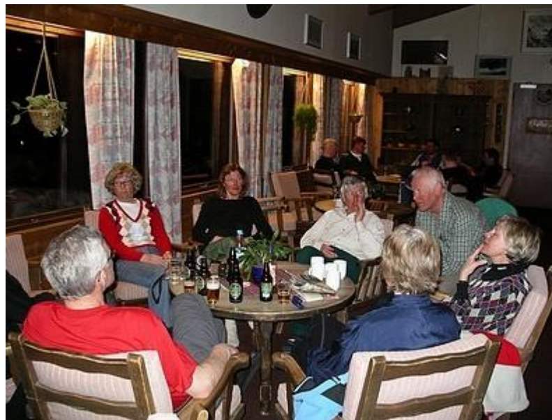
En kvällsöl i peisestuen