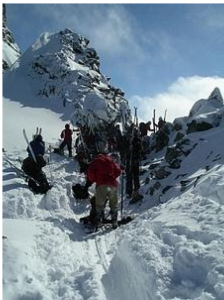
Porten, skidor tas av

Vi som inte går på toppen, skall nu passera "Porten". Det visar sig vara en upplevelse i häftigaste laget. Vi beordrades ta av oss skidorna och spänna fast dem på ryggsäcken. Det går på något vis. Ett rep åker fram och vår guide tar ena änden. Han tar sig sedan ner i en snöränna, som stupar nästan lodrätt. Vi beordras fatta tag i repet och följa efter (helst i takt). Sist går ett par starka karlar, som skall hålla emot i repet, om någon skulle snubbla eller halka. Så störtar vi oss ett par hundra meter rakt ner. Ett nytt oändligt vackert landskap öppnar sig. Vi kommer ner på Storjuvbreen, solen gassar, det är varmt och det är matrast. Bakom oss Galdhøpiggen rakt upp, Veslpiggen intill, på andra sidan Porten, och den mäktiga Skarstind rakt framför oss. Däremellan den helt orörda glaciären täckt av nysnö. Detta var en av höjdpunkterna i mitt fjälliv, och jag var glad att jag antagit utmaningen.