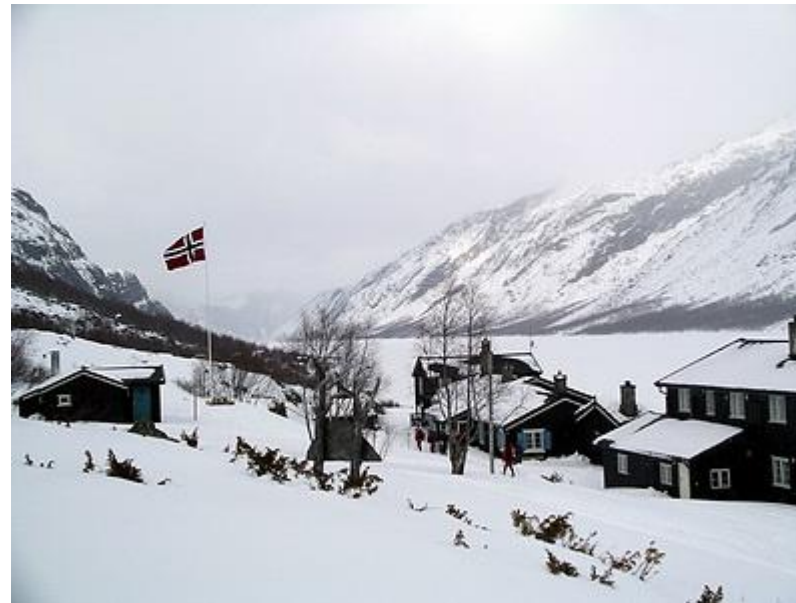
Gjendebu, vid sjön Gjende