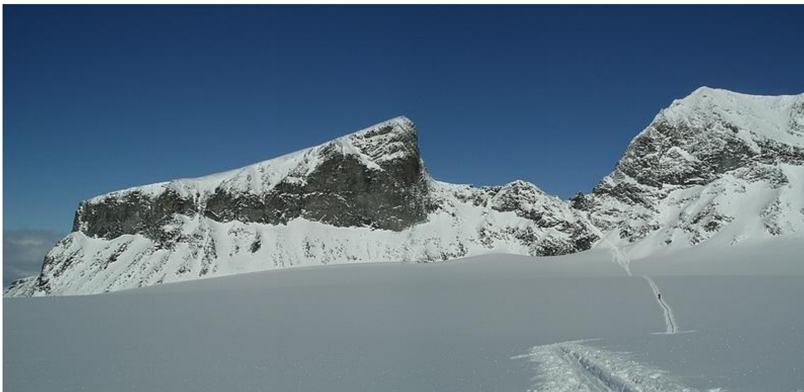
Porten med Veslpiggen och "baksidan" av Galdhöpiggen. Storjuvbreen i förgrunden.

Vi fortsatte sedan över Illåbandet som störtar brant ned på Illåbreen. Här tog de tre svenska damerna åter av sig skidorna och åkte på rumpan utför. (Vi var inte alls dom enda). Vi fortsatte sedan bort mot Tväråbandet och upp på Tväråbreen. Glaciären sluttar lite fint ner mot Visdalen och vi fick flera kilometer lätt utförsåkning i nysnön. Väl nere i Tvärådalen blev det brantare och man hade varit glad för färdigheter i telemarksåkning. Vi tog oss ned på ett anständigt sätt i alla fall, och kom fram till Spiterstulen sist av alla, upphunna och omkörda av dom som bestigit toppen, men vad gjorde det - det hade varit en fantastisk dag!