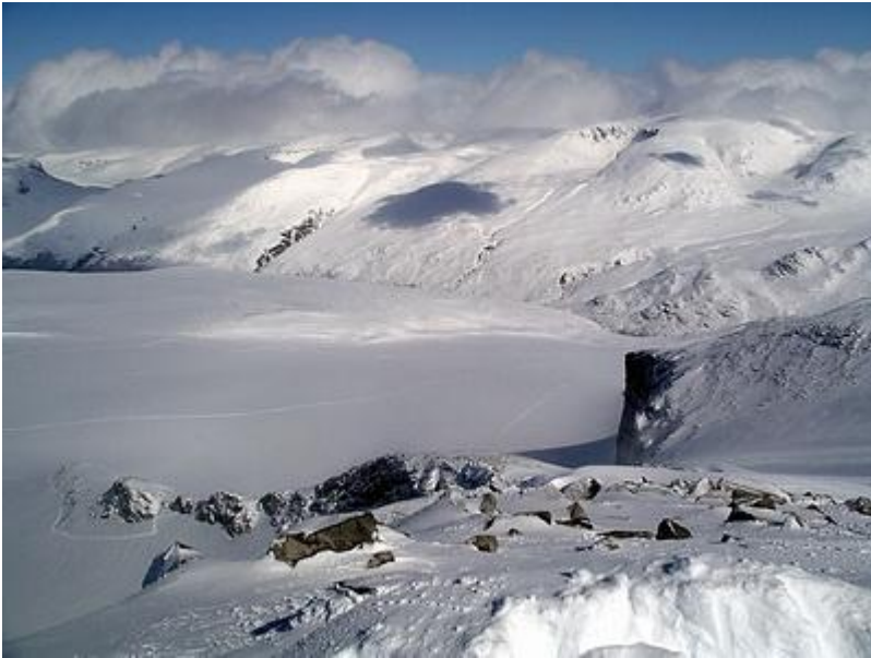
Utsikt mot Styggebrean och Glittertind