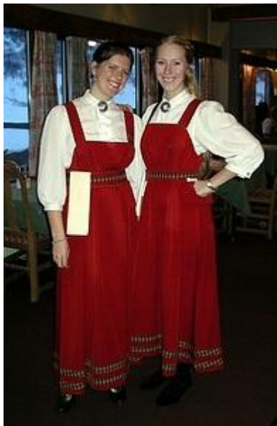
Serveringsflickorna till middagen, fint klädda