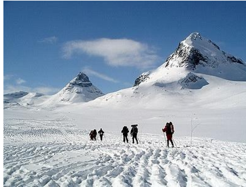
Mot Kyrkja, vi följer renarnas plogfåror