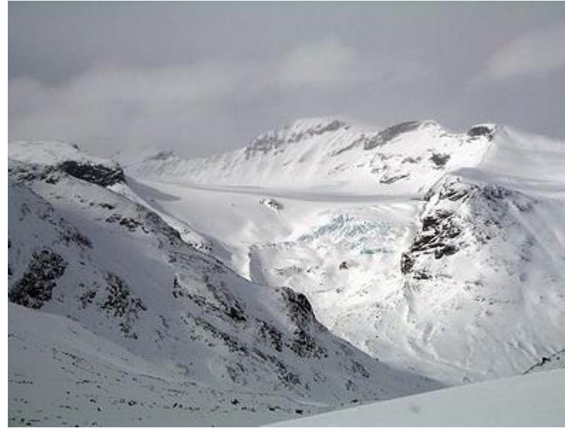
Svellnosbreen ("Eventyrsisen") från Hellstugudalen. Galdhöpiggen i mitten och Keilhaus topp höger därom.